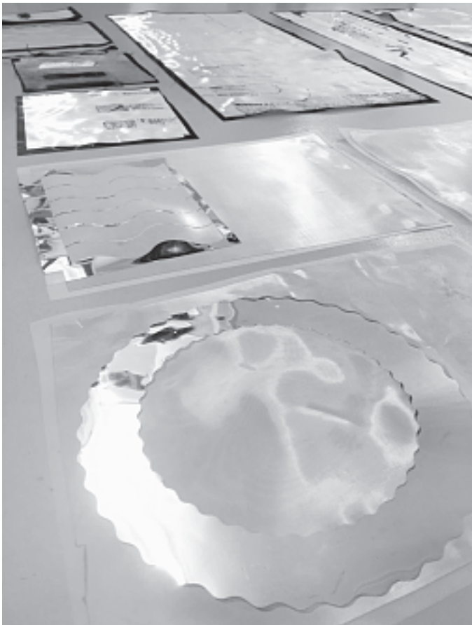
Selina Reiterer und Oliver Maklott: Work in Progress @Empa, Silberbeschichtung

ist, die Menschen ausführen, und spricht sich aus für mehr Umsicht und Menschlichkeit.